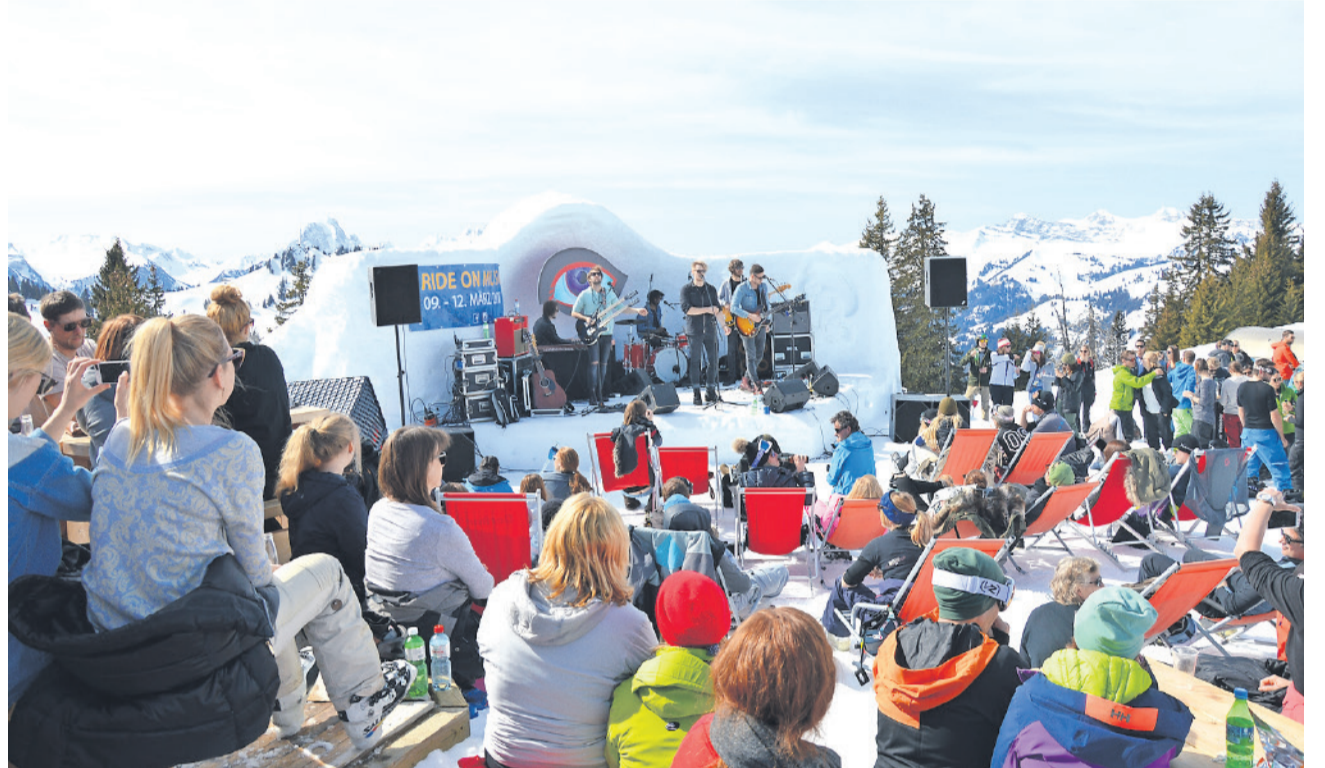
«The Souls» aus Thun spielten am Samstagmittag im Iglu-Dorf.